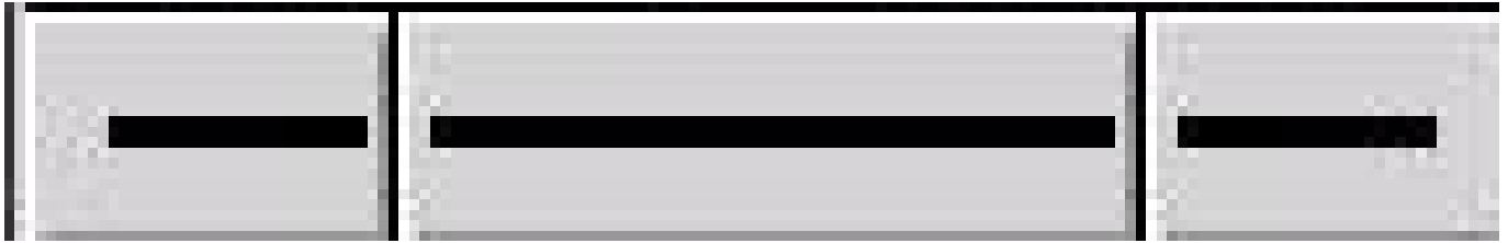
Figure 3.2: Właściwości linii

Linie mogą być w prosty sposób modyfikowane w celu tworzenia elementów jak np. strzałki. Na dole skrzynki narzędziowej znajdują się 3 przyciski z symbolami linii. Kliknięcie i przytrzymanie spowoduje otwarcie menu demonstrującego wygląd linii.